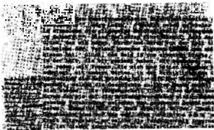
Walter Benjamin, Autógrafo de las tesis «Sobre el concepto de la historia», tesis II.

en los ultrajes, en la necesidad, en las persecuciones, y en las angustias por el mesías; cuando de hecho soy débil, entonces soy fuerte ( dynatós ). Que se trata de una verdadera y auténtica cita sin comillas está confirmado por la traducción de Lutero que Benjamin tenía probablemente ante sus ojos. Mientras Jerónimo traduce «virtus in infirmitate perficitur», «el poder se perfecciona en la debilidad»), Lutero, como la mayoría de los traductores modernos, presenta: «denn mein Kraft ist in den schwachen Mechtig», «pues mi fuerza es poderosa en las debilidades»; los dos términos ( Kraft y schwache ) están presentes en el texto de Benjamin, y es esta hiperlegibilidad, esta presencia secreta del texto paulino en el de las Tesis benjaminianas, lo que el espaciado quiere señalar discretamente.